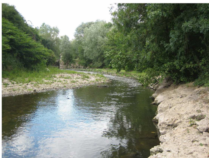
L'Yerres, août 2011, modification des faciès d'écoulement