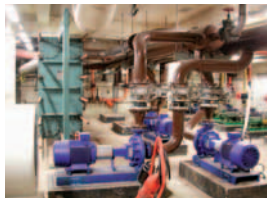
Station de réfrigération/compression