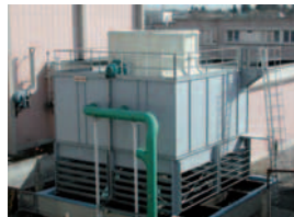
Station de refroidissement